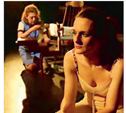
Spectacle : "Et si c'était cette nuit..."