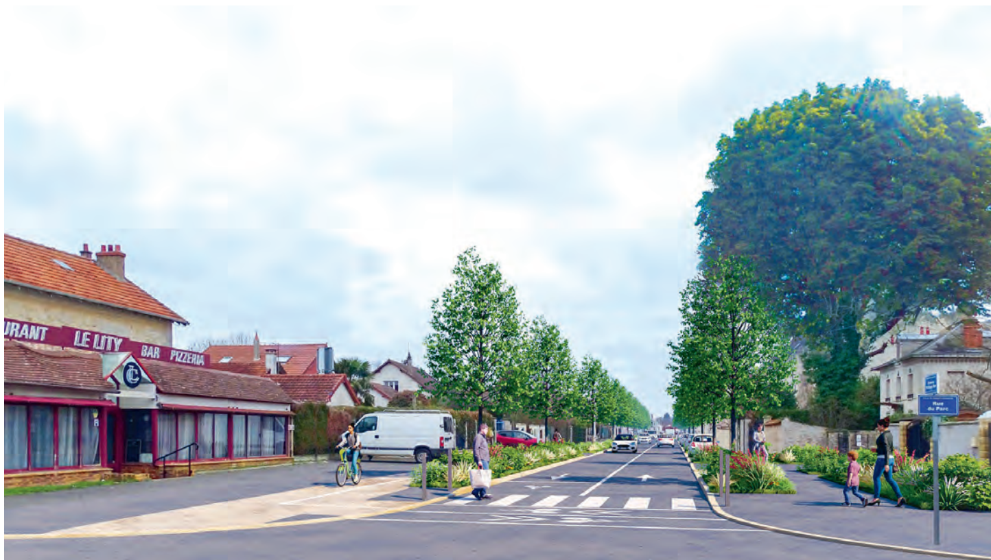
Illustration : perspective de la rénovation de l'avenue Philippe Bur présentée aux habitants lors d'une réunion publique, le 27 mars 2024.

Le chantier de rénovation du centre-ville est entré dans une nouvelle étape. Après plusieurs réalisations majeures, la transformation du cœur de Moissy continue.