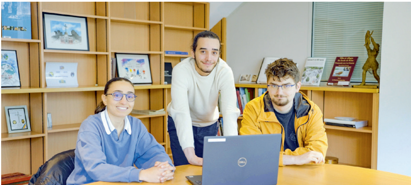
Urbanisme, communication, parc arboré, informatique... Tout au long de l'année, les services municipaux accueillent des stagiaires ou alternants.