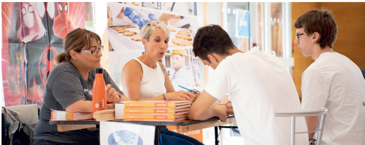
Première édition de Job dating en 2023 à la Rotonde.