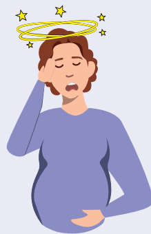
Perte de connaissance

Ces symptômes, surtout s'ils apparaissent dans un même lieu ou chez plusieurs personnes vivant ensemble doivent faire penser à une intoxication au monoxyde de carbone.