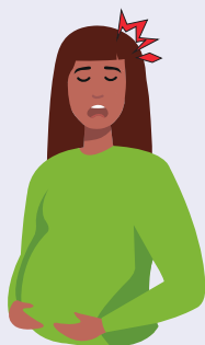
Mal de tête