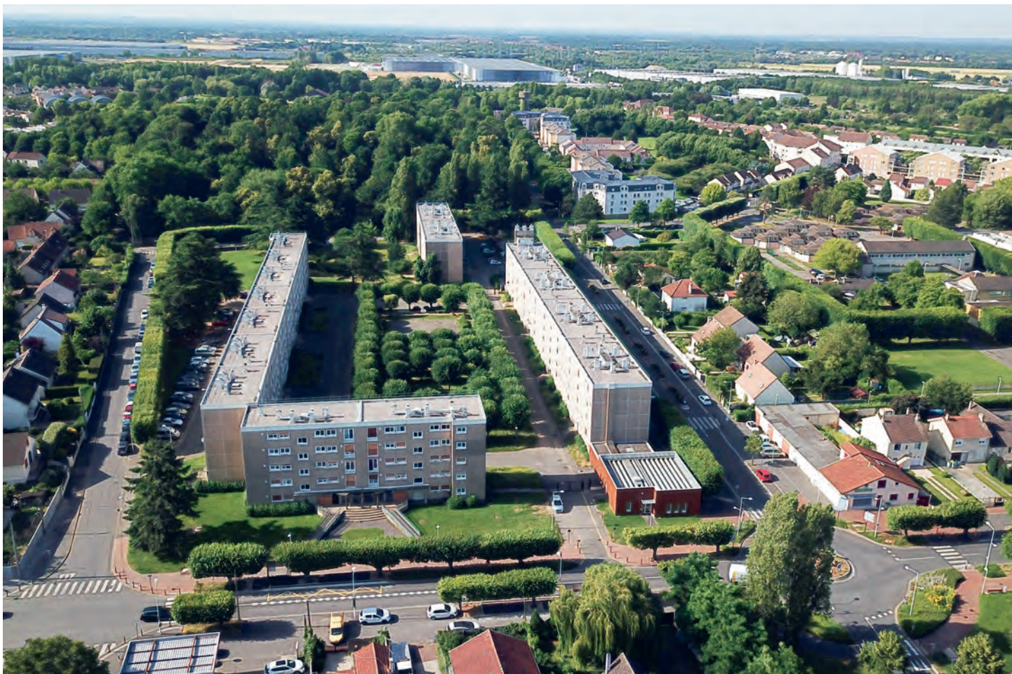
Moissy vue du ciel, photo d'archive, 2019.