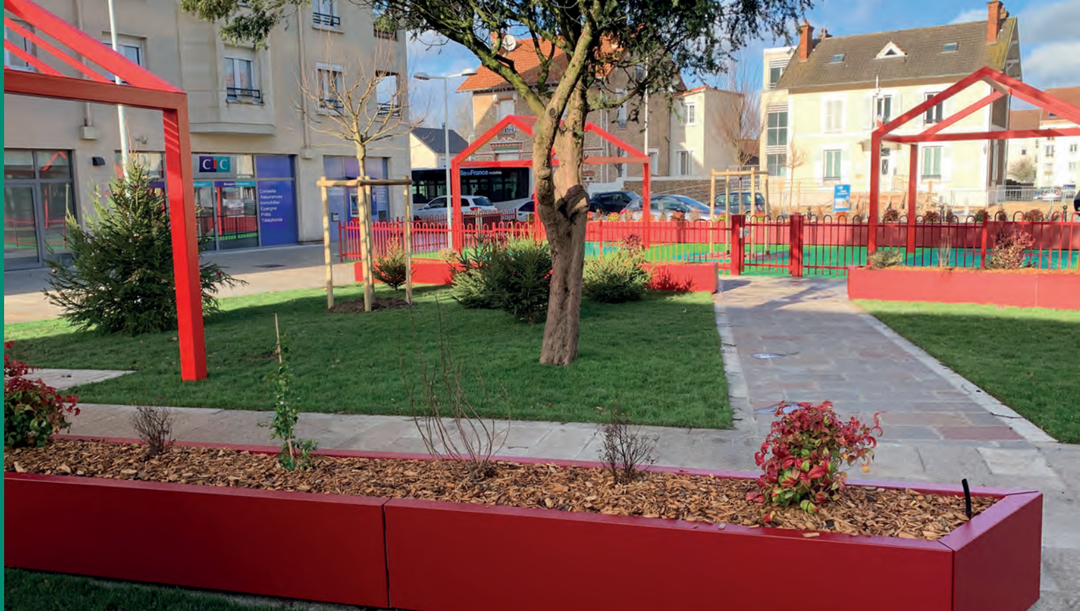
Les travaux de la place Marie Curie