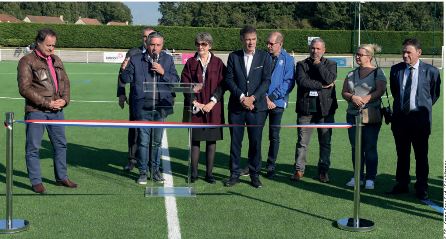
Inauguration du terrain synthétique du stade Paul Raban en octobre 2021.

Depuis un peu plus de six ans, Moissy-Cramayel fait partie de la Communauté d'agglomération de Grand Paris Sud, forte de 23 communes réparties entre l'Essonne et la Seine-et-Marne. Un partenariat sans cesse renouvelé, à la faveur notamment du Nouveau Programme de Renouvellement Urbain (NPRU) et de la requalification du centre-ville.