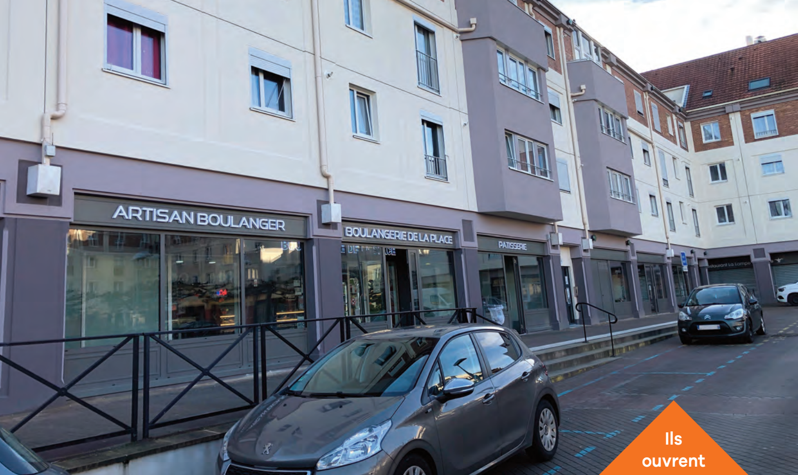
La rénovation des façades et l'avancement des vitrines place du 14-Juillet-1789.