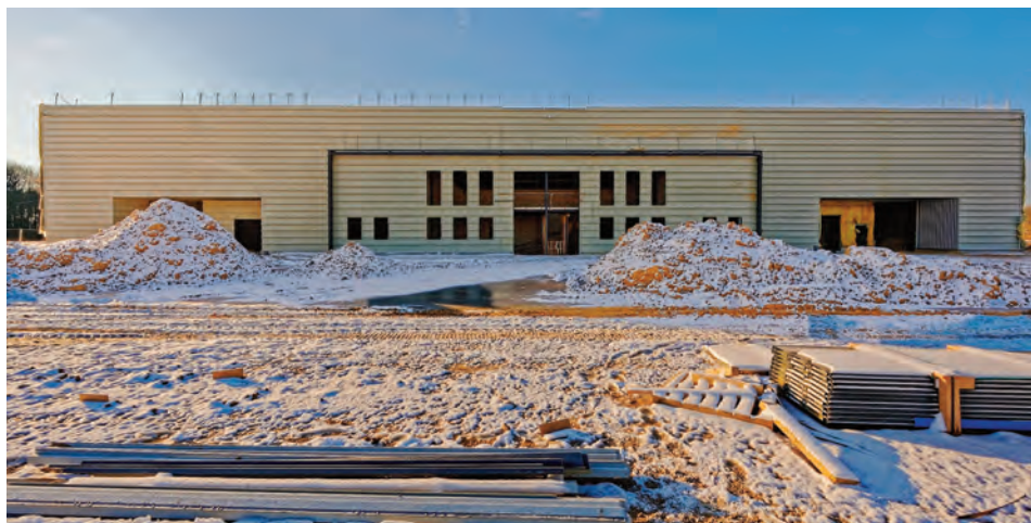
Le Closet en chantier près de l'Écopépinière de Sénart.

s'opère dans les meilleures conditions" , indique Ralph Mansour, président de la société. Le Closet, dont une partie du personnel est aujourd'hui en télétravail, compte profiter de cette nouvelle implantation pour booster un peu plus son chiffre d'affaires : 6 millions d'euros en 2019 et 6,5 millions d'euros en 2020, soit une progression de 8,33 %.