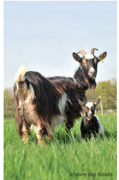
chèvre des fossés

des fleurs, des animaux et des insectes qui n'existaient plus en ville. Une façon aussi de réduire l'entretien mécanique de certains espaces, pour moins polluer, réduire les gaz à effets de serre et améliorer le bilan carbone. Sans oublier l'aspect pédagogique et social de cet éco-pâturage qui attire petits et grands autour des espaces verts de la commune. Quatre terrains accueilleront les animaux fin mars début avril : l'espace vert situé devant la gare, le parc du Centre près du centre aquatique, un terrain situé près de l'école des Grès et le quatrième devant le lycée de la Mare-Carrée. En fonction des conditions climatiques et de la hauteur de l'herbe, les animaux seront répartis sur tel espace plutôt que tel autre : chèvres des fossés, moutons d'Ouessant et, une nouveauté cette année, moutons racka, connus pour leurs grandes cornes torsadées qui peuvent atteindre un mètre d'envergure.