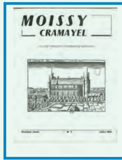
Du N° 5 (juillet 1966) au N° 24 (avril 1971)

Le château de Cramayel s'affichera de la même manière à la Une de tous les numéros suivants.