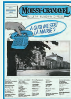
Du N° 9 (septembre 1983) au N° 25 (décembre 1987)

Changement de titre sans redémarrer la numérotation