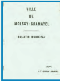
Du N° 1 (juin 1965) au N° 4 (avril 1966) Trimestriel

17 pages tapées à la main sans illustration