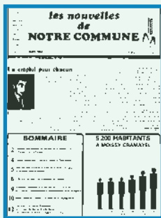
Du N° 1 (décembre 1980) au N° 8 (juin 1983) Trimestriel

Les futures Nouvelles de Moissy se caleront sur la numérotation de ce nouveau journal