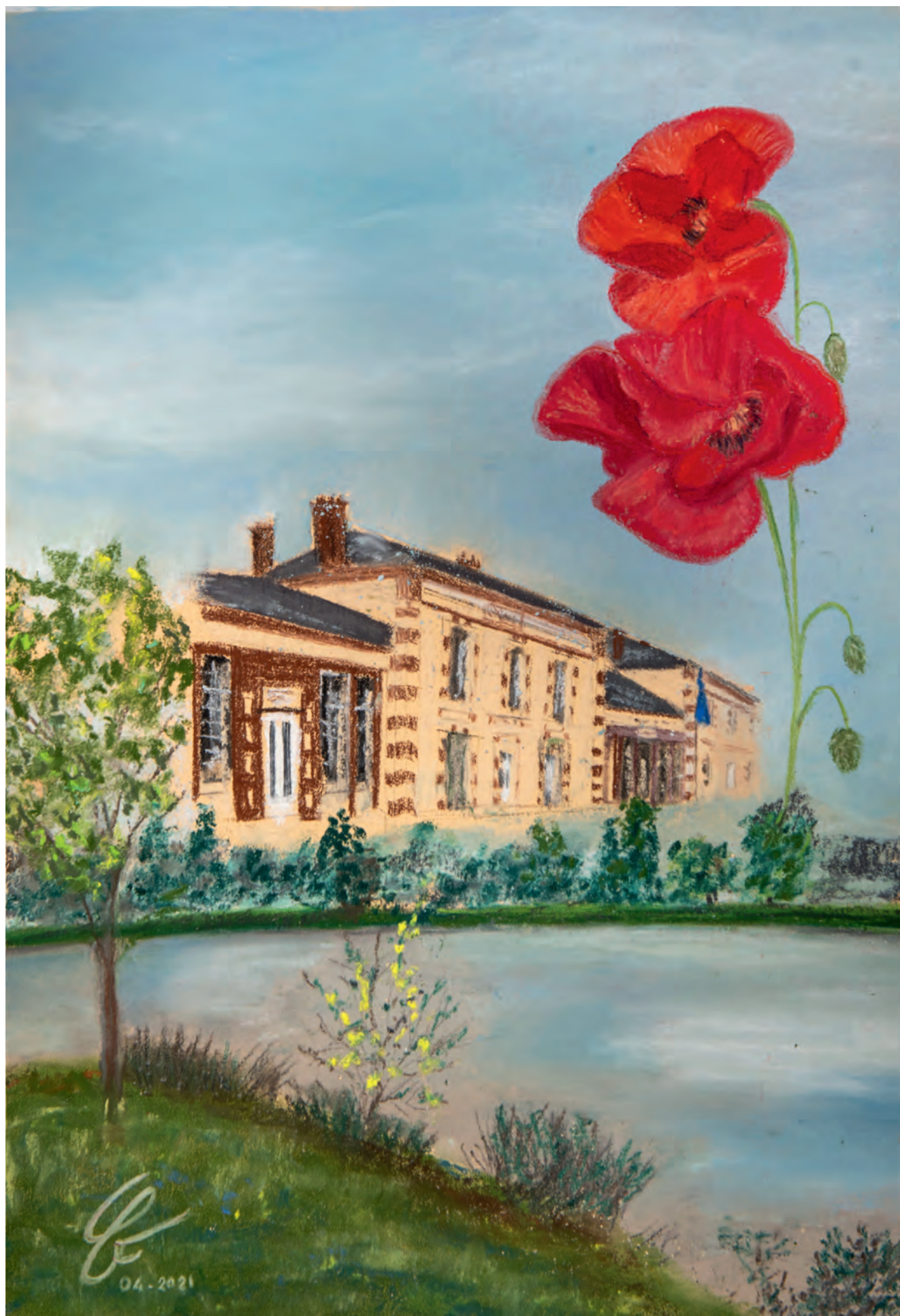
La mairie de Moissy réinventée par le pastel de Caroline Fournier-Farenzena (lire page 14).