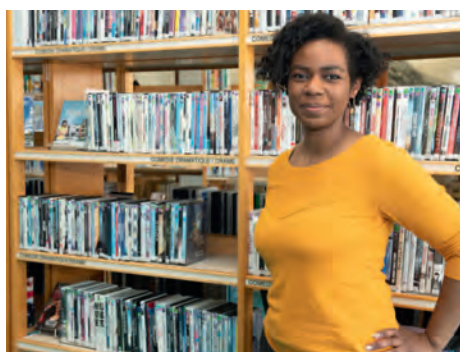
À la médiathèque.

Je participe dès que je peux à la vie de la ville. En lisant Les Nouvelles , j'ai vu que la mairie recherchait des bénévoles pour le soutien scolaire organisé l'été dernier. J'ai donc pu participer à cette opération et accompagner des collégiens en mathématiques et en français. J'ai aussi visité le forum des associations car je souhaitais adhérer à plusieurs associations, mais le confinement empêche quelque peu les activités associatives. Enfin, je fréquente les lieux culturels. Je me suis inscrite à la médiathèque de la ville que je trouve super. Avant les confinements, j'allais au conservatoire pour prendre des cours de musique, puis on s'est adapté et les cours sont depuis un moment en visioconférence. Malheureusement, je n'ai pas encore pu aller aux 18 marches ou à la Rotonde. Dès que l'on pourra, j'irai !