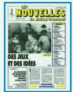
Février/Mars 1988 Parution bimestrielle

Changement de titre sans redémarrage de la numérotation du journal. Il n'existe donc pas de N° 1 des Nouvelles de Moissy.