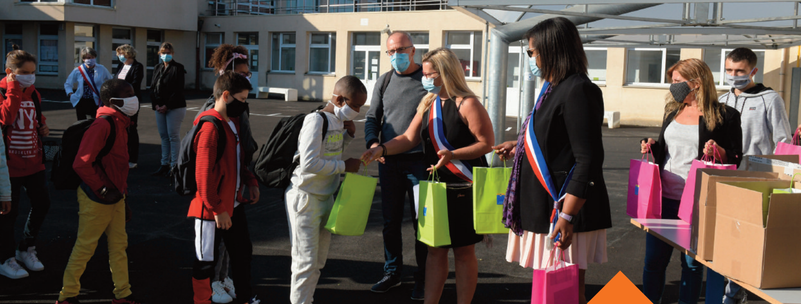
Distribution de dictionnaires de français, d'anglais ou d'allemand à tous les élèves de 6 e .