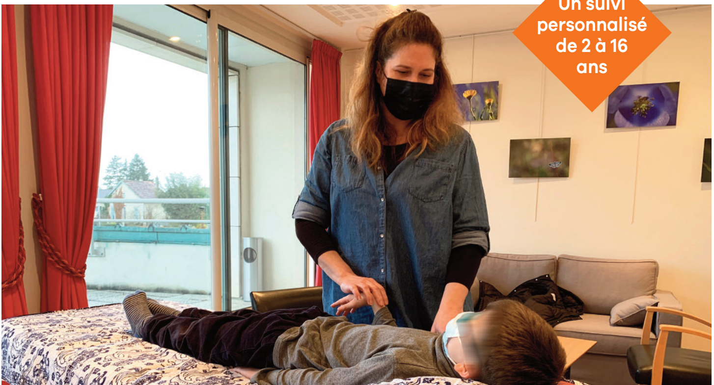
Séance de kinésiologie, une approche corporelle qui vise à retrouver un meilleur équilibre mental, physique et énergétique.