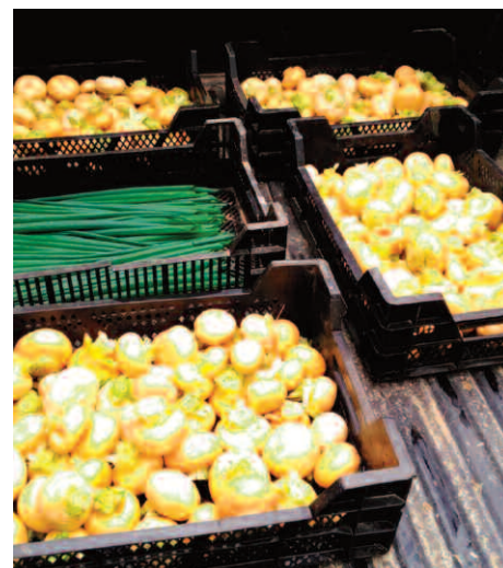
Récolte des navets Petrowski et de la ciboule.