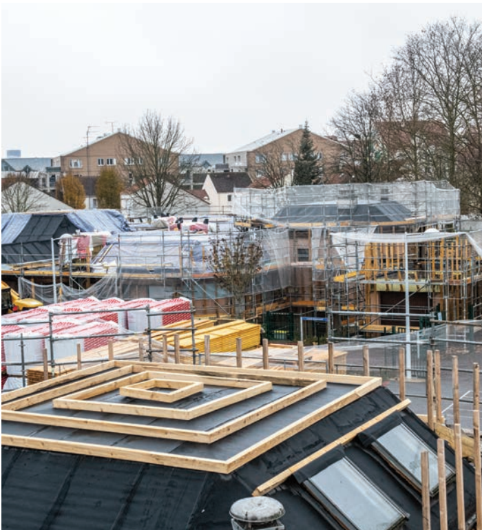
La rénovation du groupe scolaire de Lugny.