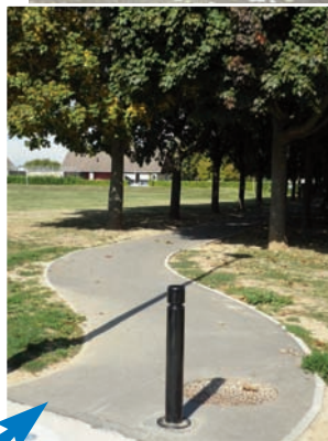
Nouvel enrobé permettant d'accéder au centre de loisirs et au groupe scolaire des Grès