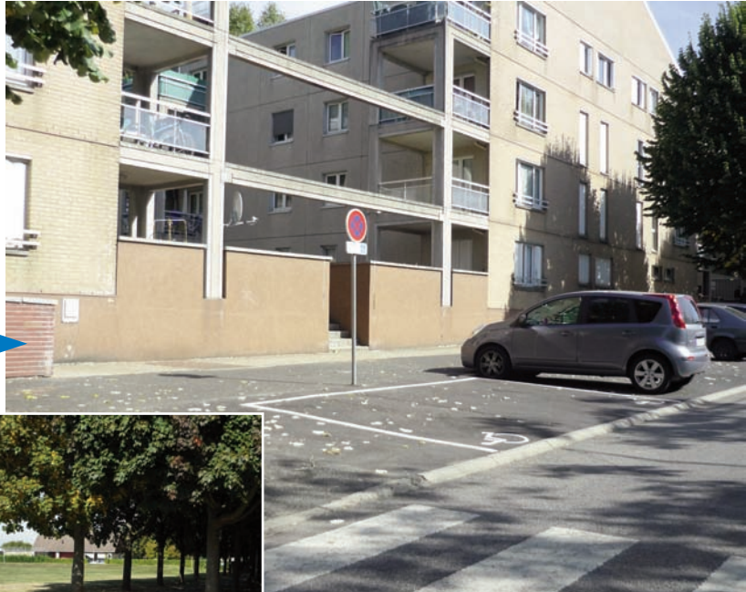
Rue des Pièces-de-Lugny 2 nouvelles places réservées