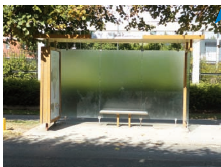
Arrêt de bus de la Mare-Carrée