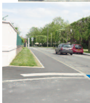
Création d'un trottoir, rue de la Croix Saint-Roch, entre les rues des Semoirs et Gabriel-Péri