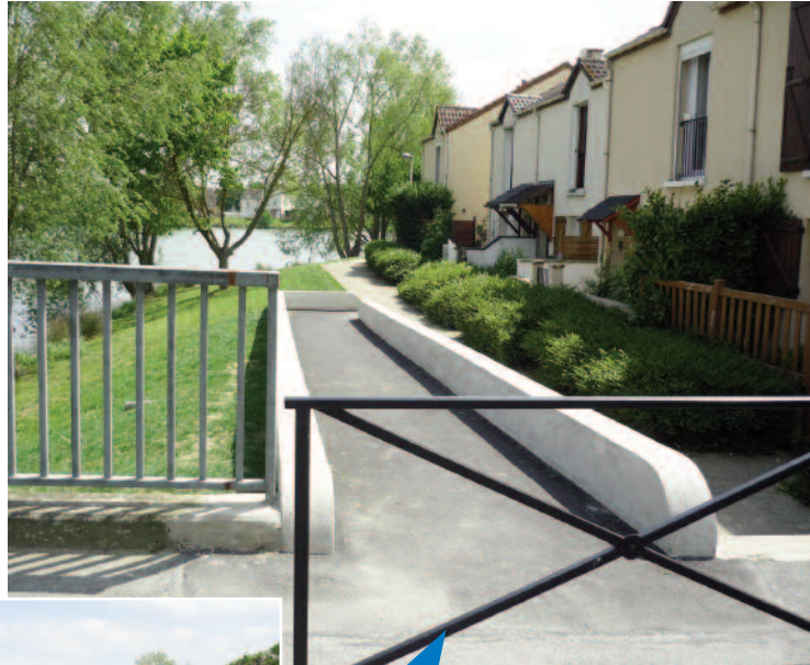
Réalisation d'une rampe d'accès au cheminement longitudinal à l'étang des Hauldres depuis le mail des Etats généraux

La commune poursuivra, quant à elle, ses travaux sur la chaîne de déplacement quartier par quartier, en privilégiant dans un premier temps les abords des groupes scolaires.