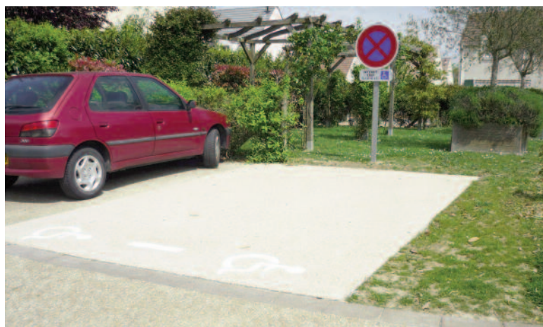
Création d'une place pour Personne à mobilité réduite (PMR), place de Liège

En lien avec d'autres partenaires (le San, les communes de Sénart, l'EPA, etc.), la commission est chargée de dresser l'état d'accessibilité du cadre bâti existant, de la voirie, des espaces publics, des transports et de proposer de nouveaux aménagements adéquats conformes à la mise en accessibilité de l'existant. Cette année, la commission disposera d'un budget d'environ 65 000 euros pour la réalisation de travaux d'accessibilité. Ce budget devrait être alloué à la réfection du trottoir entre le gymnase du Noyer-Perrot et la rue de Touraine pour améliorer l'accès au groupe scolaire et à la maison de quartiers.